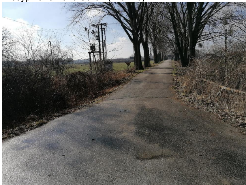
Neošetrované hlavové vŕby na ramene Soliari