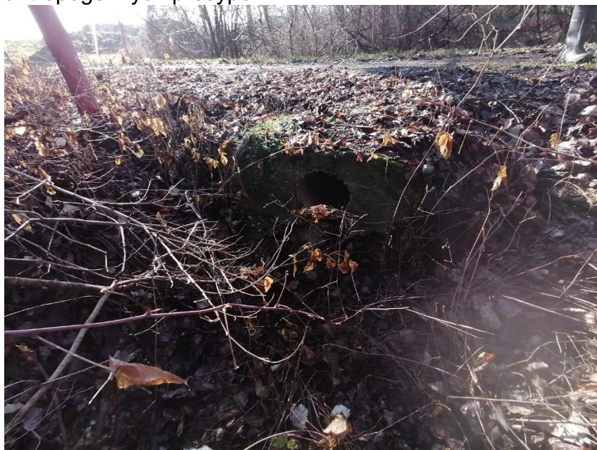
Presyp na ramene Soliari (k farme)

Presyp cez rameno Soliari – priemer cca 300 mm. Na ramene sa nachádza celkovo 8 antropogénnych presypov.